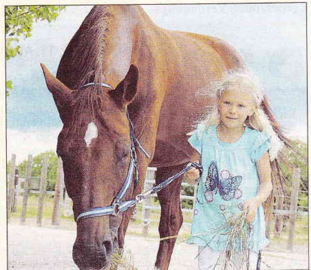
Auch Kinder werden in ihrer Entwicklung gefördert